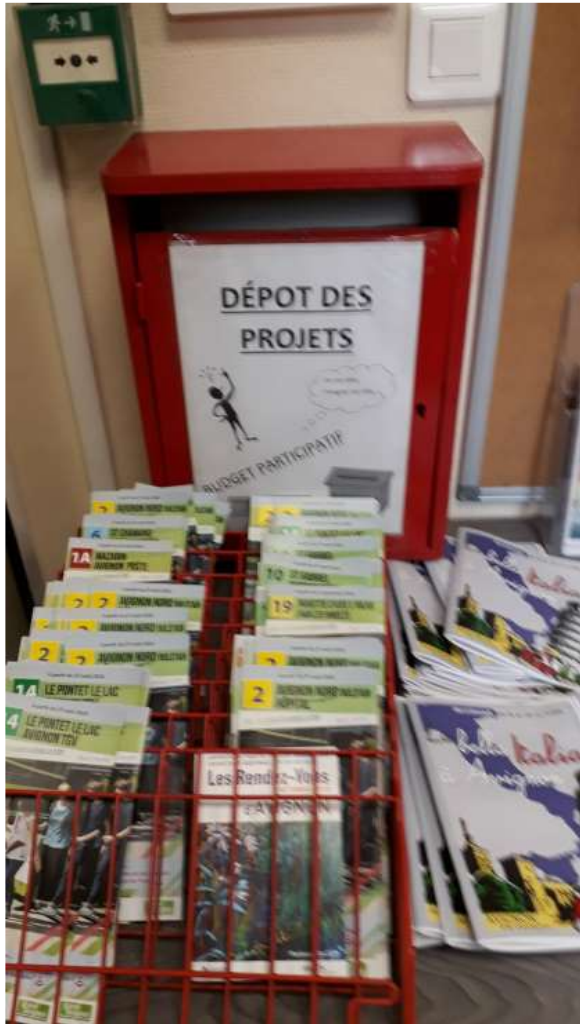
Figure 1. Une urne de dépôt des projets du BP de la mairie Ouest (entre alarme incendie, horaires de lignes de bus et programmes d'un événement culturel)